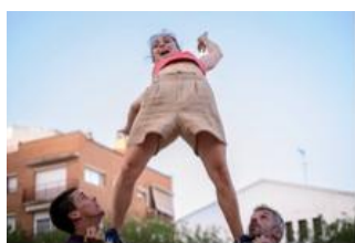
A rienda suelta