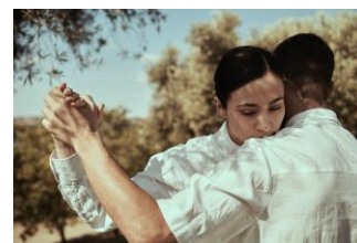
Bailaban las Perolas