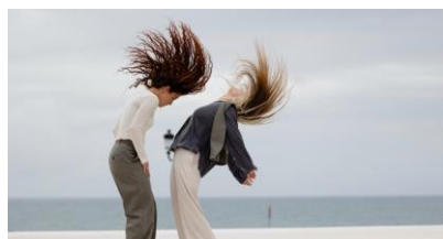
Pies de Gallina