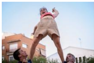
A rienda suelta