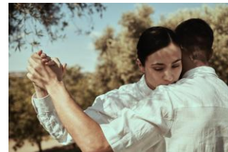
Bailaban las Perolas