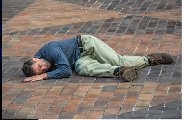
The Beauty of It

Àngel Duran Performing Arts representará tres de sus espectáculos en diferentes eventos, durante este mes de octubre.