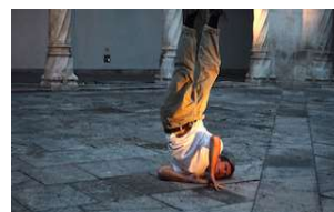
The beauty of it