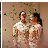
Olor de menta