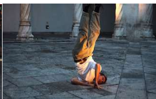
The beauty of it