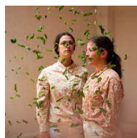
Olor de Menta