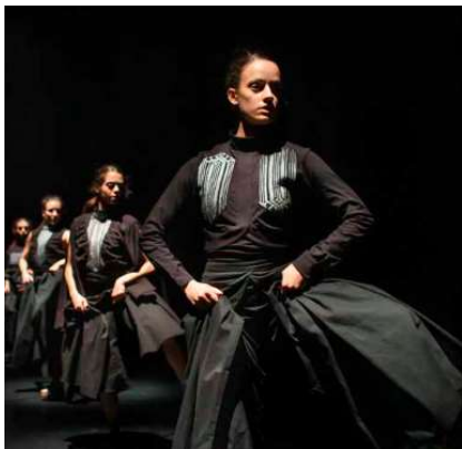
Omen of Farisa , Danae & Dionysios