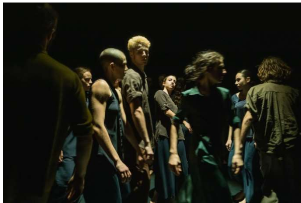
Despite the Siren Call , Fre3 Bodies